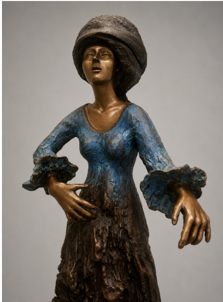
Contadina slava, 2020, Bronzo organico (fusione a cera persa), cm 95x25x26

Una selezione di opere disponibili appartenenti alle principali serie di AlbertiniArt: Sculture per la Pace , Bronzo organico , Biosculture e figure femminili simboliche. Le opere sono realizzate soprattutto in bronzo a cera persa e alluminio, in alcuni casi ceramica o materiali compositi, con formati adatti a gallerie, collezioni private e progetti espositivi.