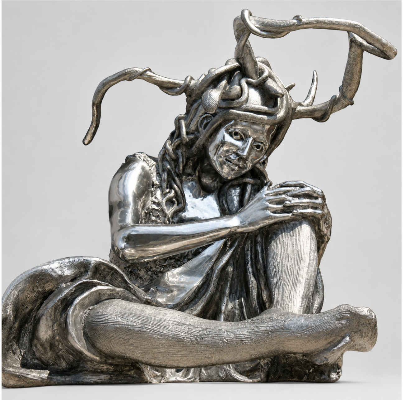
Il nuovo volto di Medusa metallo lucidato, 92 × 110 × 85 cm, 2023

Medusa non come mostro, ma come volto della ferita. Opera-faro. Violenza, sguardo, resistenza. Forma contemporanea del mito.