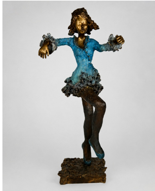
Tulle Blu, 2012, Bronzo organico (fusione a cera persa), cm 76x40x30