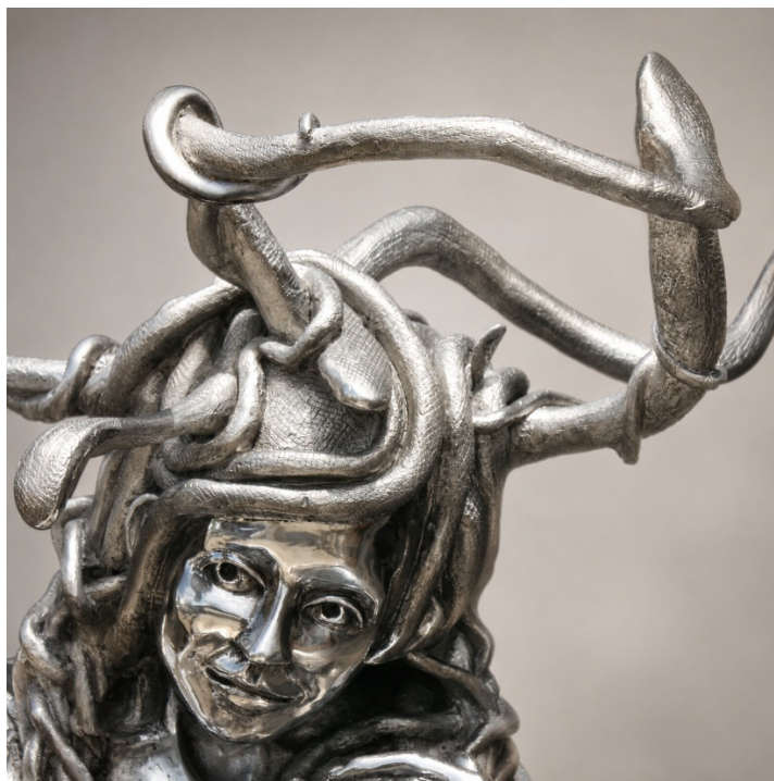
Il nuovo volto di Medusa (particolare)

Medusa è la ferita. Giuditta è la resistenza. Arianna è la speranza.