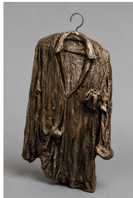
Camicia, 2005, Alluminio fusione a cera persa), cm 100x60x15