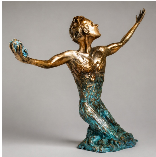
David che va in guerra, 2022, Bronzo organico (fusione a cera persa), cm 42x37x18

Il corpo non è più soltanto figura mitica o simbolica, ma presenza vulnerabile dentro la storia: guerra, pace e responsabilità. Le biosculture nascono dal rapporto tra natura, corpo e materia. Legno, cera, ceramica e bronzo vengono attraversati e modellati come organismi in trasformazione. Attraverso la fusione, il bronzo organico conduce la fragilità originaria dei materiali verso una forma di permanenza e durata, verso l'eternità della forma. Ciò che nasce fragile viene così consegnato alla resistenza del tempo.