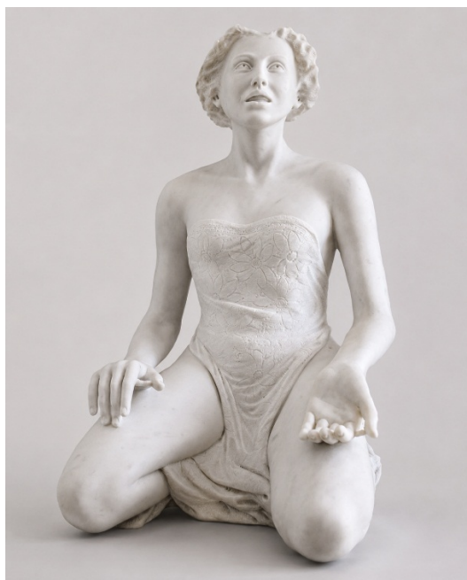
Il sospiro di Giuditta, 2024, Marmo Michelangelo, cm 65x50x45