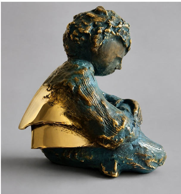
Bimbo imbronciato, 2022, Bronzo organico (fusione a cera persa), cm 34x30x30