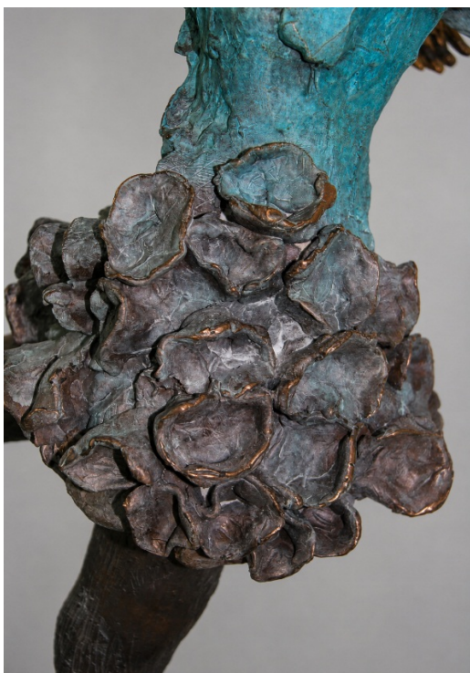
Particolare “Tulle Blu”, Serie sulla punta, 2012, Bronzo organico (fusione a cera persa), presentata a Venezia 2017