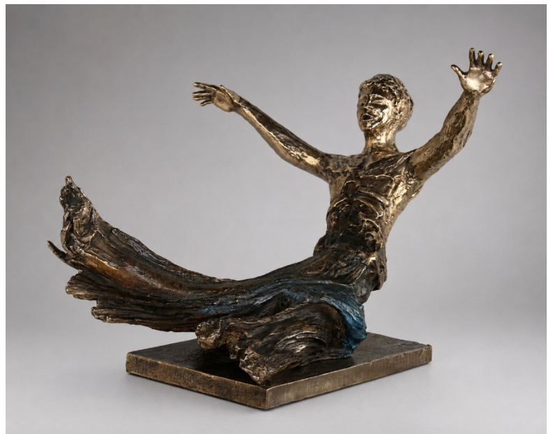
Tuffo nella neve, 2021, Bronzo organico (fusione a cera persa), cm 37x49x60