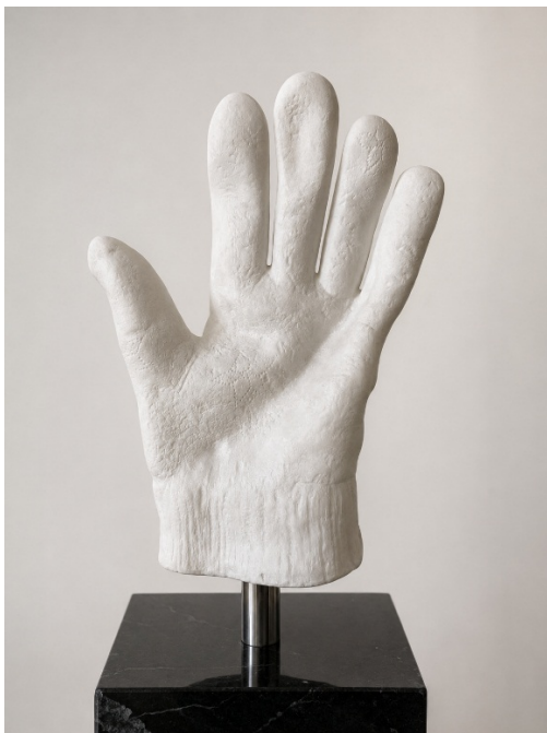
Stop, 2024, Marmo bianco e nero assoluto, cm 46x28x25